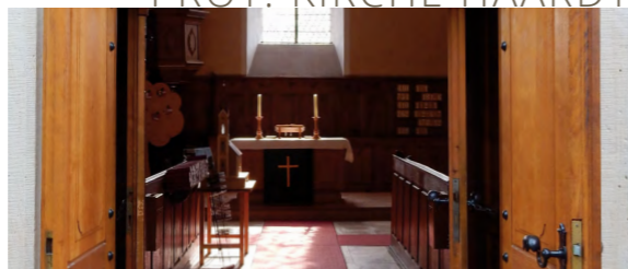
PROT. KIRCHE HAARDT

Bahnhofstraße 1, 67434 Neustadt an der Weinstraße, Tel. 06321-926812 www.neustadt.eu/Wein-Tourismus/Stadthalle-Saalbau