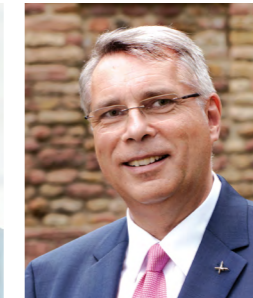
Christian Schad Kirchenpräsident der Evangelischen Kirche der Pfalz