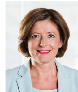
Malu Dreyer Ministerpräsidentin des Landes Rheinland-Pfalz

NEUSTADT.EU/WEINLESEFEST NEUSTADT.EU/GENUSS Gesamtprogramm erhältlich bei der Tourist-Information Neustadt an der Weinstraße Hetzelpatz 1, Tel. 06321-92680